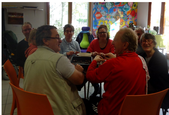
Tout le monde aux fourneaux.... pour l'atelier cuisine