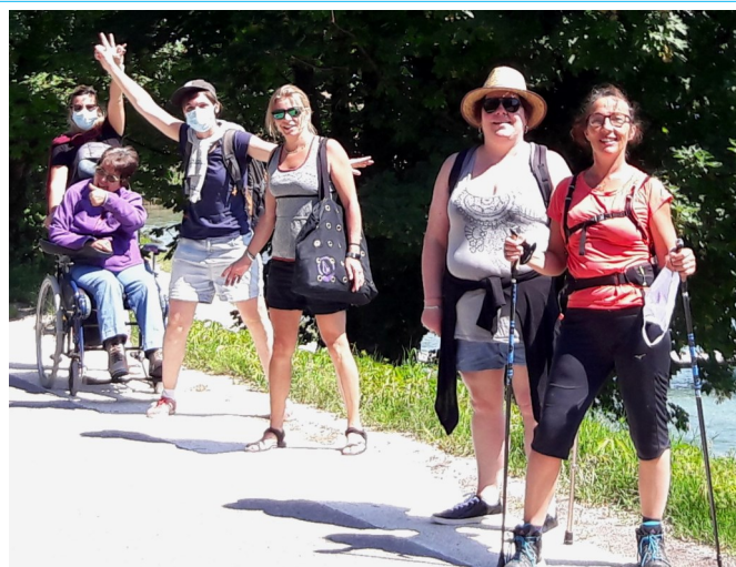
S'aérer un max pour éviter la Covid, c'est la devise de La Renaissance. On joint l'utile à l'agréable en admirant les street-arts.