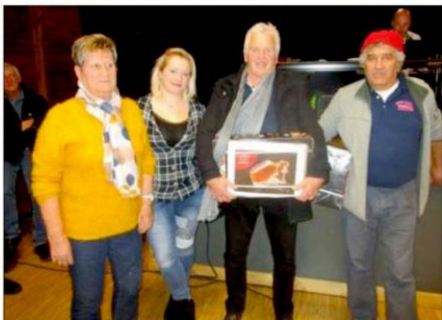
Les premiers et les troisièmes gagnants.