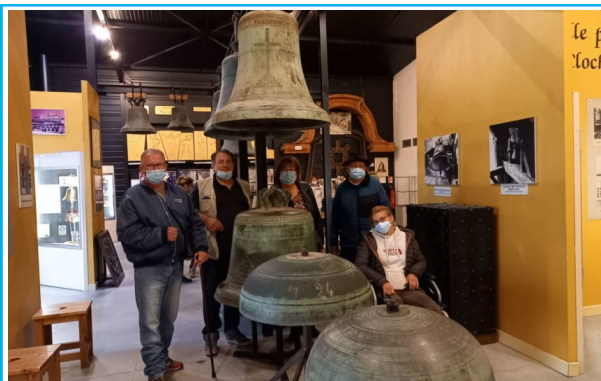
Visite du musée des cloches Paccard