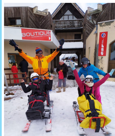
Sport d'hiver pour tous les goûts. Merci aux accompagnateurs-pilotes