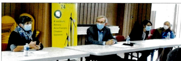
Comment mieux connaître les malades, les familles et les besoins sur le territoire ? C'était la question posée lors de l'assemblée générale.