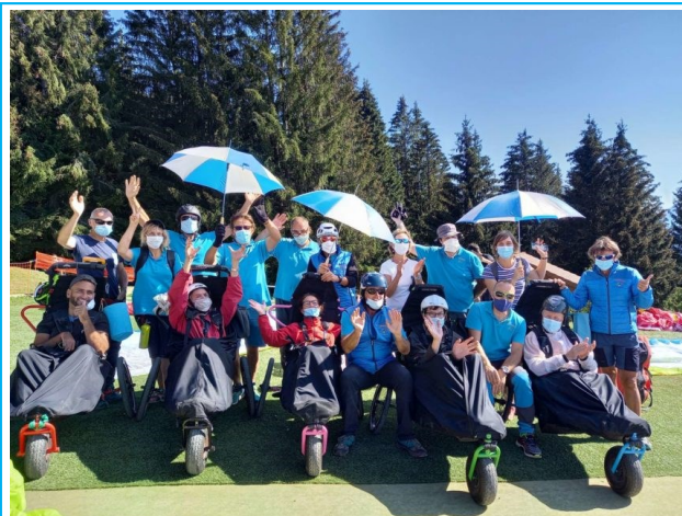
Parapente À La Forclaz.