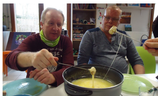
La traditionnelle fondue savoyarde de l'hiver.

Après la fondue savoyarde, on change de menu : les nouilles chinoises.