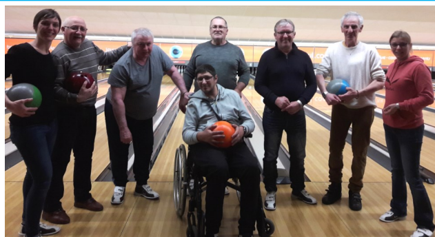
Le bowling, une activité qui attire.