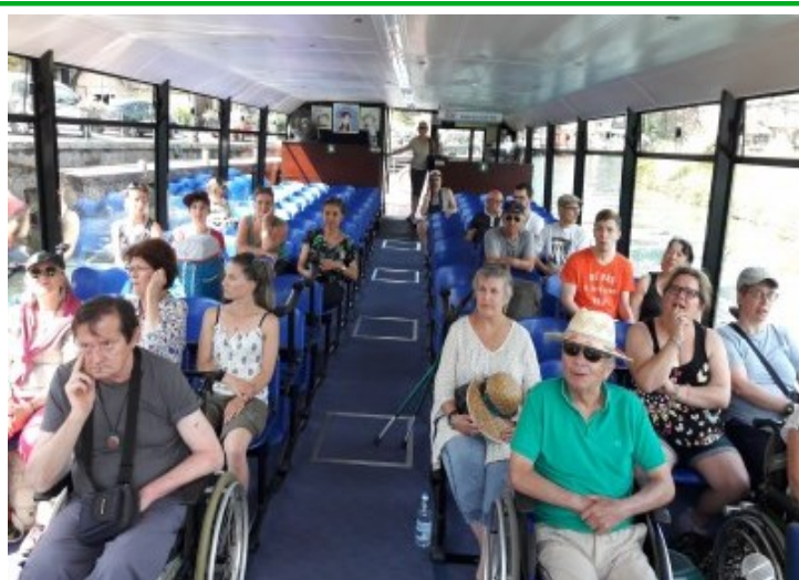
Croisière sur le Canal de Savières