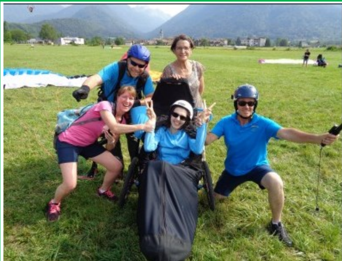
Nos Gêmeurs font du parapente