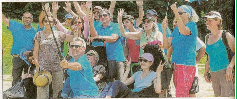
Les bénévoles qui ont accompagné et permis aux personnes en situation de handicap de participer à un survol mémorable.

Mardi 25 juin, certains adhérents cérébro-lésés se sont élancés du col de la Forclaz au-dessus du lac d'Annecy en parapente biplaces accompagnés des bénévoles de l'association Annecy Handi'Bi. Depuis plus de 10 ans, ils propo-