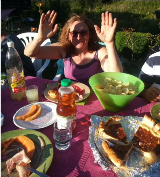
Rencontres de familles dans la joie et la bonne humeur