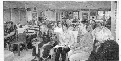
L'association Le Re-Naissance propose une multitude d'activités pour les personnes cérébro-lésées.

Ce GEM accueille des personnes cérébro-lésées adultes, victimes de traumatisme crânien, d'AVC, de tumeur cérébrale, d'anoxie. C'est un lieu d'écoute, d'entraide, de socialisation, de partage et d'échange ouvert tous les jours de la semaine. Vous pouvez venir juste boire un café ou participer à une activité, dans une ambiance