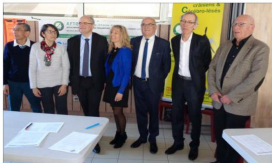
Cette assemblée générale a permis aux participants de revenir sur le travail remarquable effectué depuis 25 ans par l'Association des familles de traumatisés crâniens et cérébro-lésés.