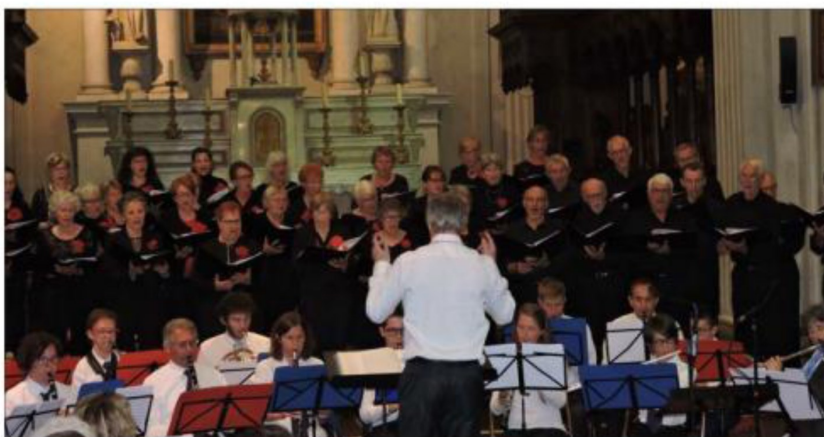
Les ensembles Résonances et Harmonie du Mont Blanc se sont réunis.

Près de 250 mélomanes avaient pris place dans l'église. Dans le chœur se trouvaient une quarantaine de chanteurs et une vingtaine de musiciens. Chaque musique de film était annoncée de façon humoristique. Dauphiné Libéré