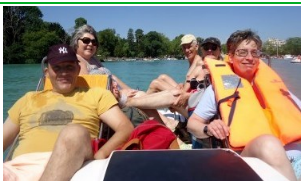
Ils font trempette