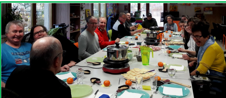
Et savent apprécier leur repas dans la joie et la bonne humeur

Contacts : tél. 04 50 67 52 64 et le site : http://renaissance74.fr/